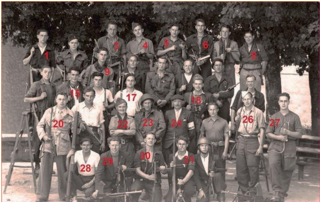
Août 1944, 6 e section de la 21 e compagnie du 5 e bataillon FFI du Morbihan. Section Guémené 2

Puis il retrouve les élèves du lycée et du collège de jeunes filles réfugiés depuis le 3 janvier 1943 à Guémené-sur-Scorff. Au moment du débarquement, il intègre une formation Forces Françaises de l'Intérieur vannetaise. Lors des combats sur la poche de Lorient, il rejoint ses anciens camarades. Le 5 décembre 1944, à Kervignac, il est pris sous le tir d'une mitrailleuse allemande, et tombe, blessé à la tête, à l'âge de 18 ans.