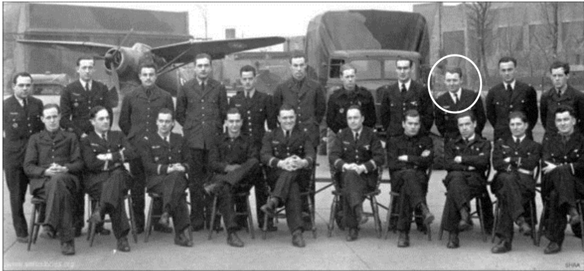
Elementary Flying Training School (EFTS) d'Odiham, février 1941

Dès les premières rumeurs de l'armistice, il rallie la Grande-Bretagne pour terminer sa formation dans les écoles de la Royale Air Force avant de prendre part à la libération de la France. Il est parmi les premiers Français à rejoindre de Gaulle en Angleterre. Il signe un engagement dans les Forces Aériennes Françaises Libres créées par le Général le 1 er juillet 1940.