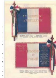
Drapeau du 1er RA Collection d'Annie Thomas.