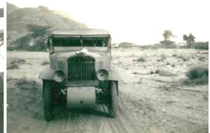
Camion P 107 sur la piste - Erythraea - Mars 1941 - Collection d'Annie Thomas.