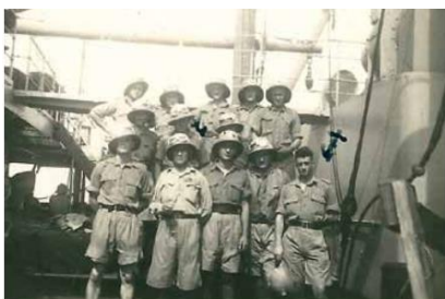
A bord du paquebot Pennland - Collection d'Annie Thomas.