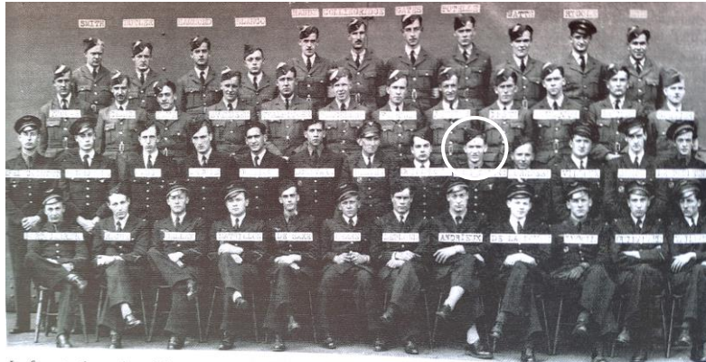
Les Français élèves-pilotes de la 5 SFTS. Les Ailes françaises 1939-1945 n°7