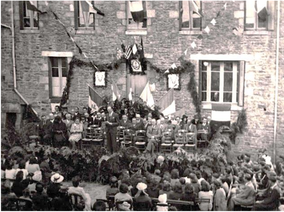
Discours du proviseur du 11 juillet 1945, marquant la fin de la période guéménoise : extrait concernant l'engagement dans la Résistance.