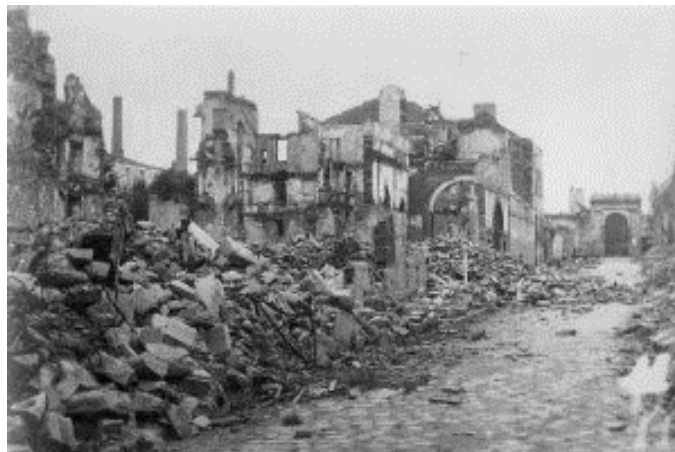
Une partie de la façade du lycée après les bombardements de janvier 1943

Le 14 janvier 1943 dans la soirée près de 200 avions alliés déversent sur Lorient plus de 50 000 bombes incendiaires. Les quelques professeurs restés au lycée ainsi que leurs élèves tentent de sauver au matin quelques livres et objets de la bibliothèque qui ne brûle pas encore. A midi, le lycée est évacué et de nouveaux bombardements achèvent la destruction de la ville.