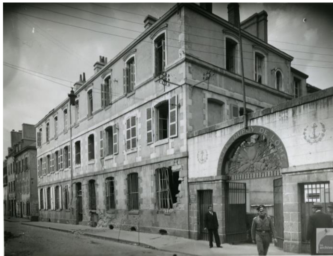
Le parloir, touché par les bombardements du 27 septembre 1940

Les premières alertes aériennes ont lieu pendant le second trimestre de 1940. Deux bombes touchent le lycée sans exploser : en voulant les neutraliser, les Allemands endommagent le salon d'honneur au rez-de-chaussée, l'appartement du proviseur et le secrétariat au 1 er étage.