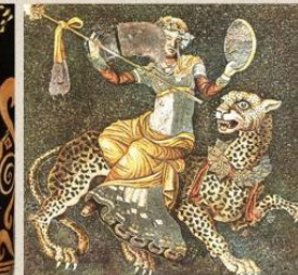
Délos, Maison des masques, Dionysos sur un guépard 2e moitié IIe s. av. notre ère