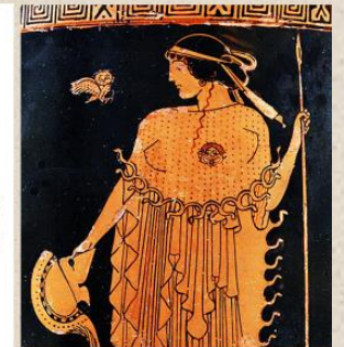
Lécythe attique à figures rouges Attribué au peintre de Brygos 490-480 av.