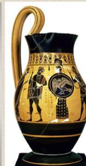
Olpé attique à figures noires Peintre d'Amasis Vers 550-530 av