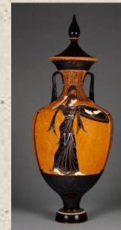
Amphore - Jeux Athéniens 340-339 av.

Ses attributs : la lance, le casque, le bouclier, l'égide avec sa tête de Méduse et ses serpents, et pour finir la chouette.