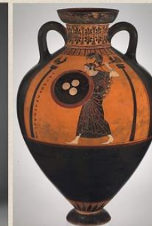
Amphore en terre cuite de la période archaïque (530 av)