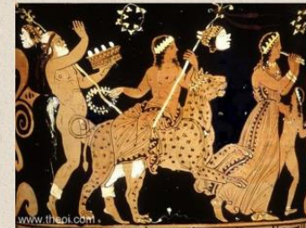
Peintre de Louvre, Vase attique, Dionysos assis sur une panthère, à gauche un papposilène (facies plus bestial) joue du tambourin. Face A d'un cratère en cloche à figures rouges, v. 370 av. notre ère, découvert à Paestum.