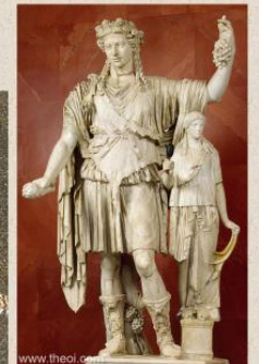
Dionysos-Bacchus, marbre Gréco-Romain, IInd siècle av.